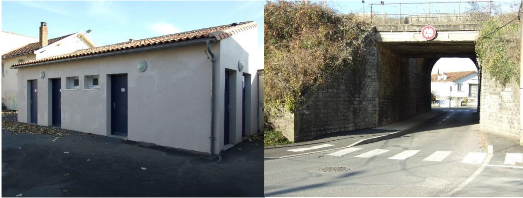
Réfection des sanitaires de la Maison de quartier – Aménagement piéton sous le pont SNCF.