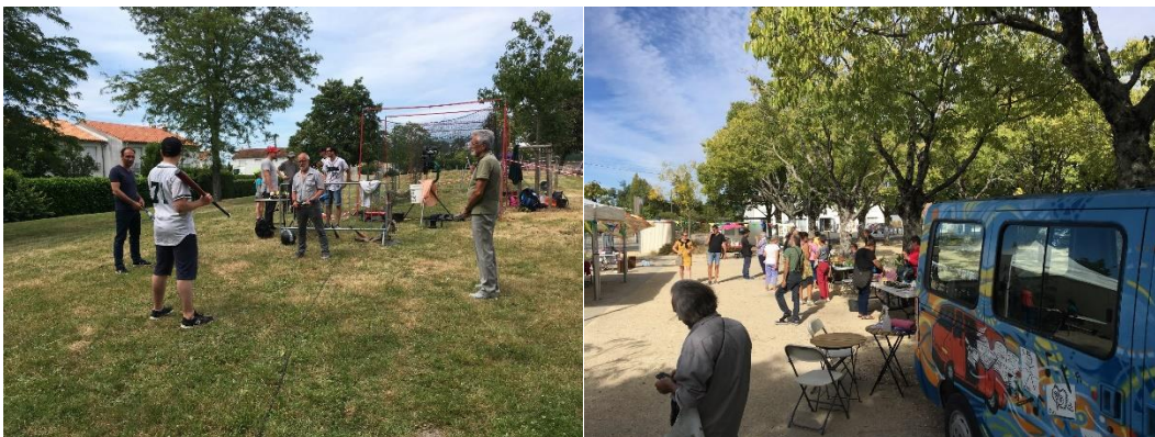
Journée thématique sur le Sport-Santé – Troc de plantes place Georges Renon