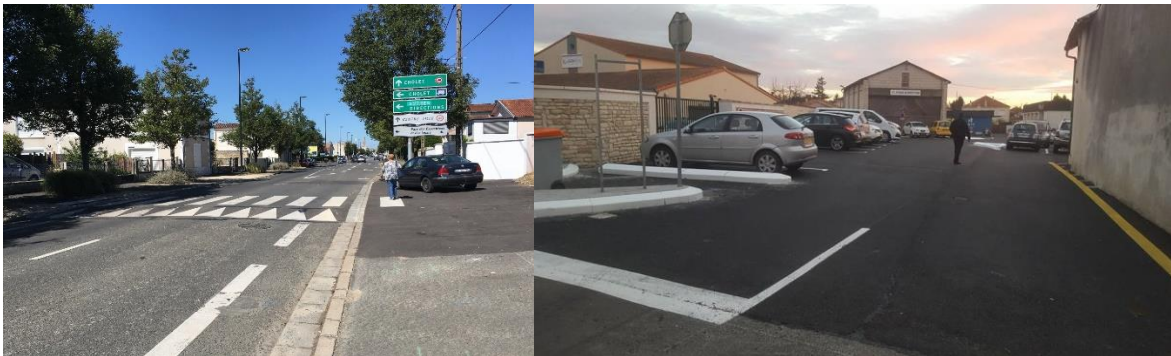
Plateaux surélevés de l'avenue Saint-Jean d'Angély – Parking de la rue de la Convention