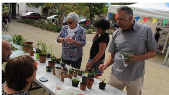
Quatrième édition du Troc aux Plantes hier après-midi, place Georges-Renon. « On peut échanger une plante contre un conseil de jardinage. L'important, c'est l'échange humain. »